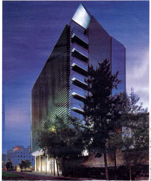
► La luminotecnía acentúa la plástica del Corporativo Las Flores.

Cortés Miguel Arquitectos, Paul Czifrom y Werner Huthmacher.