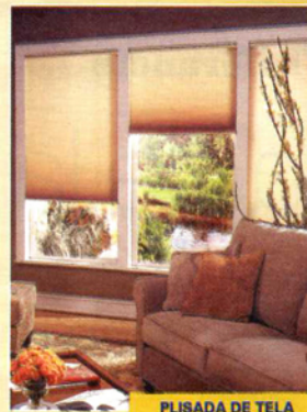
PLISADA DE TELA