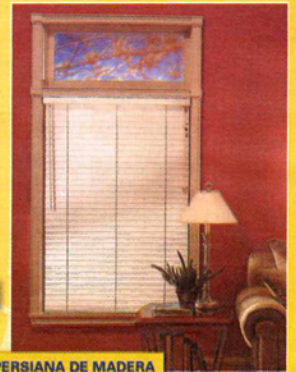
PERSIANA DE MADERA