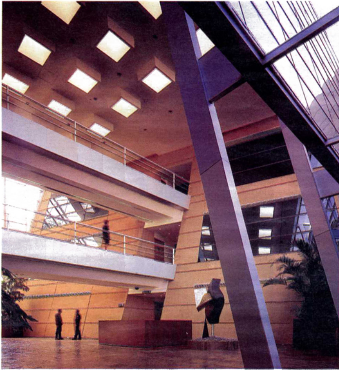
► En el vestíbulo de un corporativo destacan los puentes volados y las columnas inclinadas.