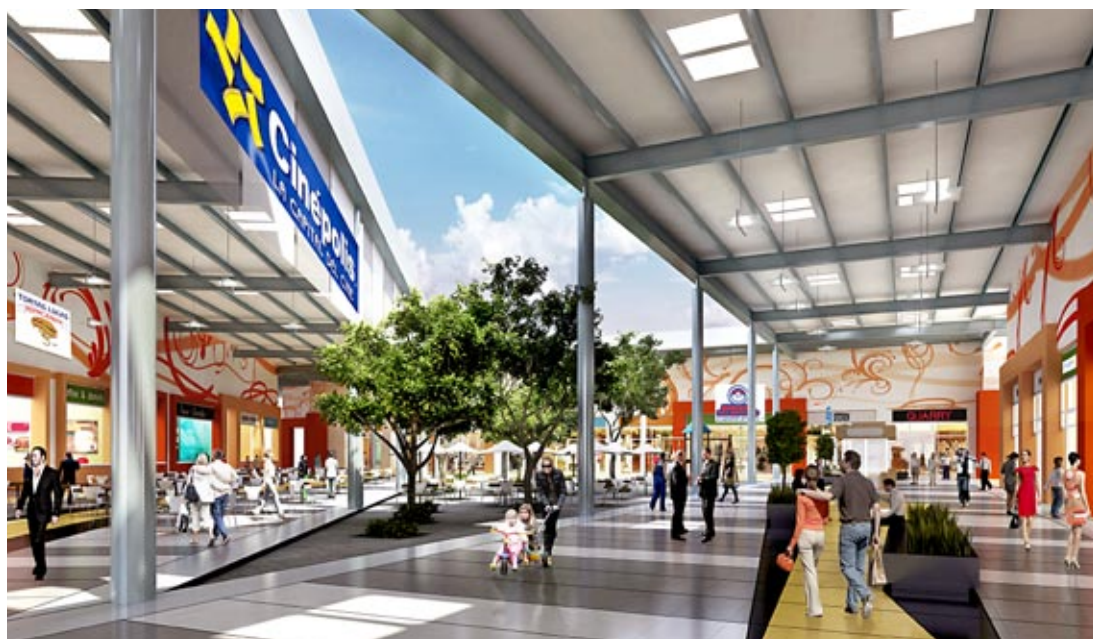
Las familias podrán realizar sus compras y disfrutar de esparcimiento.