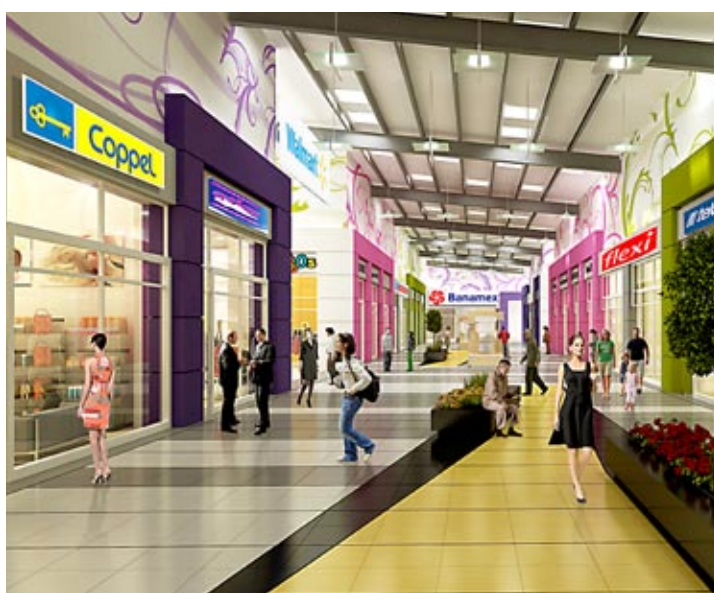
Variada oferta comercial y servicios de la más alta calidad.

“El resultado de ubicar un proyecto de esta magnitud en la ciudad del Bicentenario más grande del Estado contribuirá a generar una significativa cantidad de fuentes de trabajo, causando de esta manera una importante derrama económica para el municipio.”