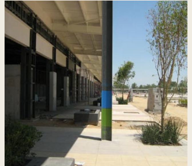
Sólida y funcional construcción.

Al ser un centro comercial de primer nivel, contribuye a que la calidad de vida y el nivel socio-económico del municipio se eleve, generando empleos, oportunidades y una eventual mejora económica, además de optimizar las condiciones con que ahora realizan sus compras, ofreciendo cercanía, seguridad y limpieza, con las mejores opciones comerciales que normalmente sólo se encuentran en las grandes ciudades. “Rentar un espacio comercial en Town Center Zumpango es una gran oportunidad. No se quede fuera, quedan pocos locales; contáctenos hoy y forme parte de tan importante proyecto”, enfatizan los desarrolladores.