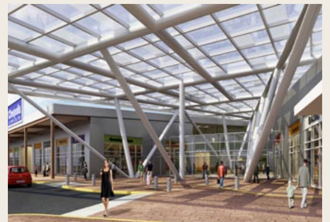
Diseño arquitectónico que sobresale.