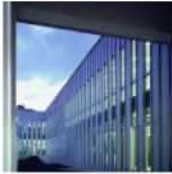
Call Center Churubusco / PRODUCTORA