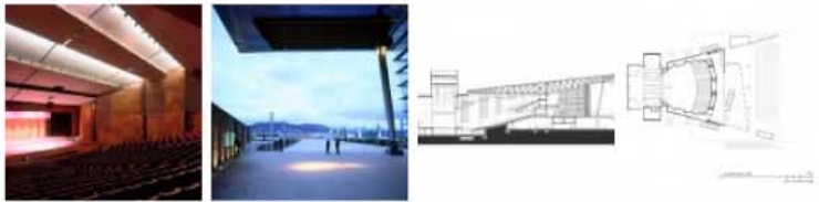
corte longitudinal planta balcon