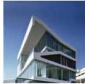
Smooth Building / Jorge Hernandez de la Garza