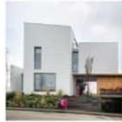
Las obras mexicanas mas vistas este 2012