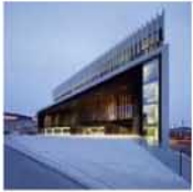
Opera House Linz / Terry Pawson Architects