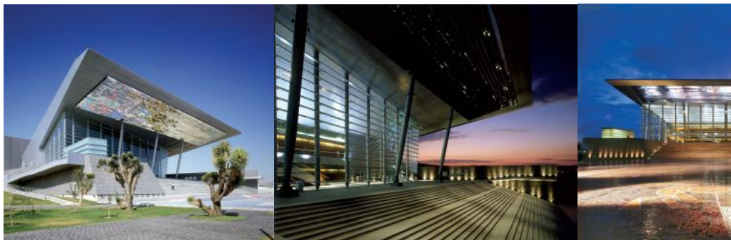
TEATRO AUDITORIO GOTA DE PLATA

ARQUIBOOX > Arquitectura > Migdal Arquitectos