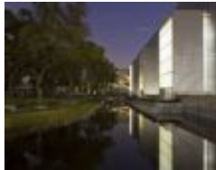
Town Center El Rosario