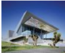
TEATRO AUDITORIO GOTA DE PLATA