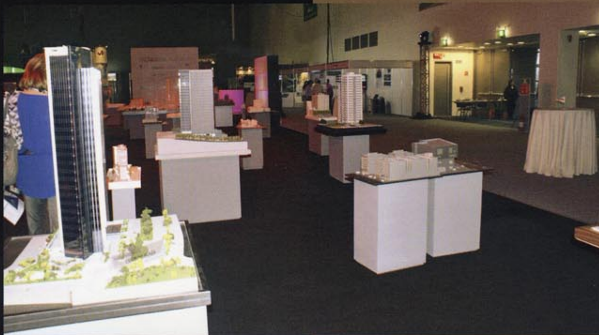
En una plataforma se colocaron los proyectos a escala de los participantes.

Además, destacó que estos esfuerzos lo han llevado a ser de las marcas con más presencia en redes sociales, triplicar la venta en alimentos y consolidar su participación de mercado, a parte de contar con una sinergia muy importante con los centros comerciales, como un lugar generador de tráfico.